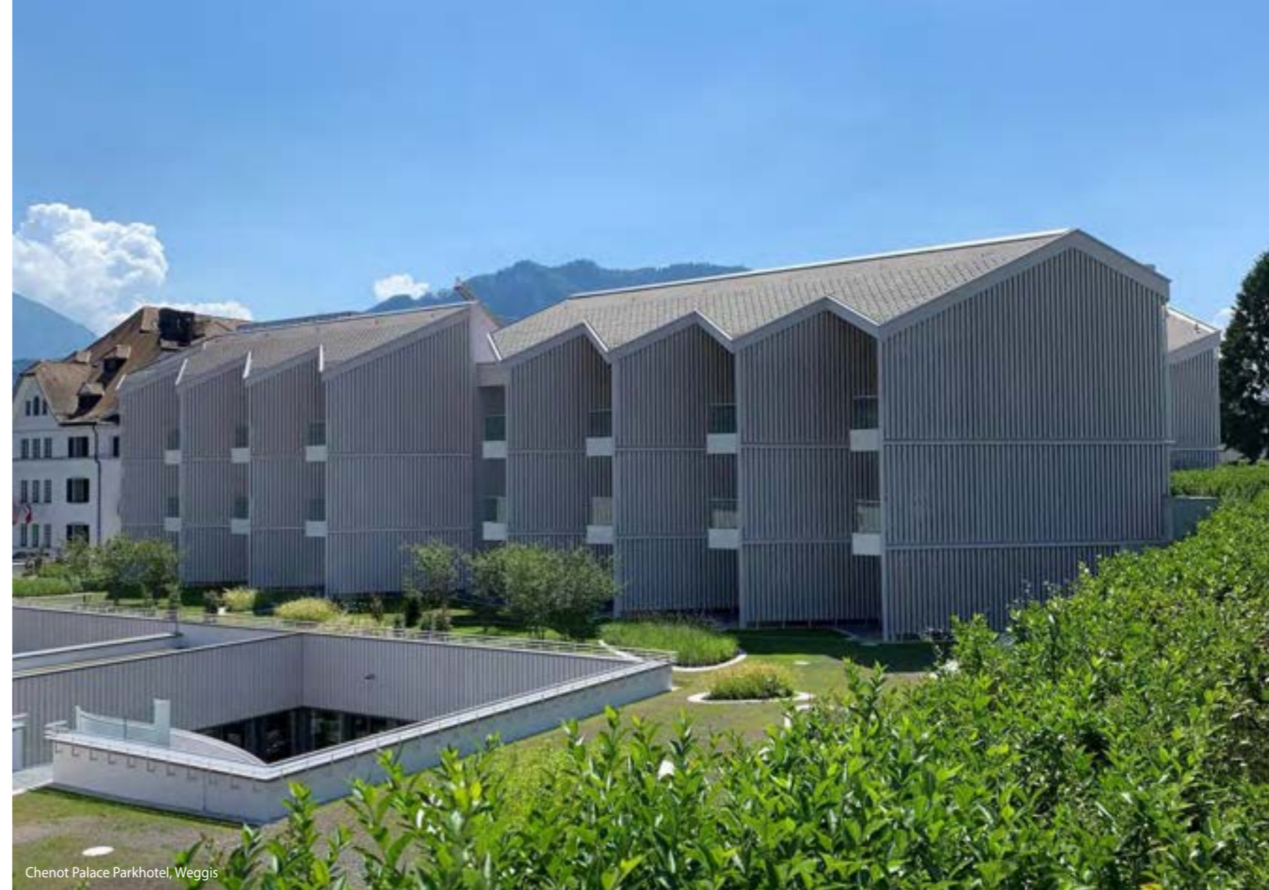
Chenot Palace Parkhotel, Weggis